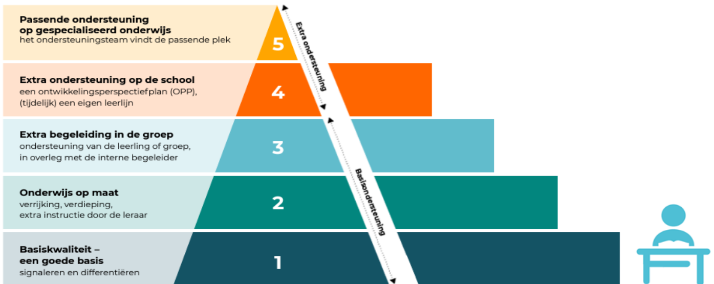
Piramide handelingsgericht werken (HGW)

De werkwijze heeft vijf niveaus van ondersteuning. Die wordt vaak met een piramide uitgebeeld. Hoe hoger het niveau, hoe meer ondersteuning en overleg er nodig is. De piramide ziet er zo uit: